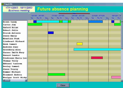
Planning des absences